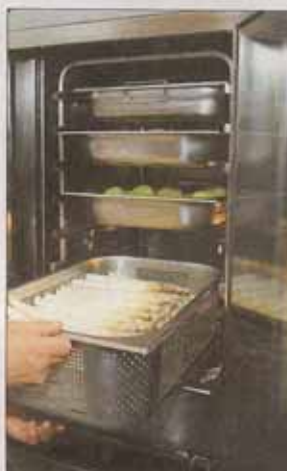
Vitaminschonend wird der Spargel im mehrstöckigen Dampfgarer zubereitet.

Käse raffeln, in die Sauce rühren und schmelzen lassen. Mit Salz, Pfeffer und Muskatnuss würzen. Schinken in Streifen schneiden, Eier abschrecken, pellen und in Scheiben schneiden. Die Hälfte der Eischeiben in eine gefettete Auflaufform legen. Schinken darauf verteilen, die Hälfte der